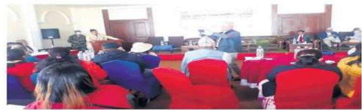
पोखरामा शुरु भएको मानव अधिकार रक्षक प्रादेशिक सम्मेलनमा सहभागी।

मानव अधिकार रक्षकहरूले सत्ता र शाक्तबाट श्रेट हुनेगरेको गुनासो गरेका छन्। राष्ट्रिय मानव अधिकार आयोगले रक्षक पोखरामा आयोजना गरेको मानव अधिकार रक्षक प्रादेशिक सम्मेलनमा सहभागी मानव अधिकारवादीहरूले मानव अधिकार रक्षकलाई सत्ता र शाक्तबाट श्रेट हुने गरेको बताएका हुन्। समाधान संवाददाताले उजुरी दर्ता