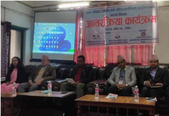
मानव अधिकार सम्बन्धी पाँचौं राष्ट्रिय कार्ययोजना कार्यक्रमहरूको अवस्था विषयक अन्तरक्रिया कार्यक्रम - पर्वत