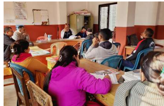
अनिवार्य, निःशुल्क तथा गुणस्तरीय शिक्षा अनुगमन, लम्जुङ