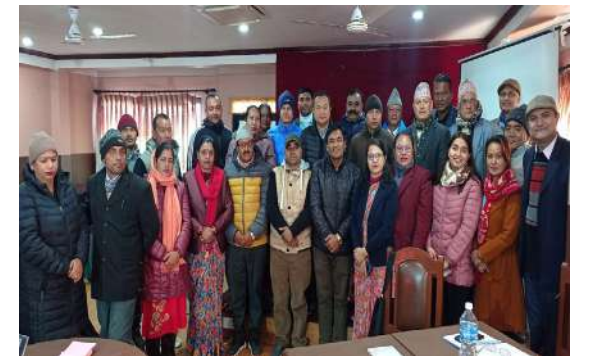
विकासमा मानव अधिकारमुखी पद्धति (HRBA) विषयक स्याङ्जाको वालिङ नपामा सम्पन्न गोष्ठीका सहभागीहरु