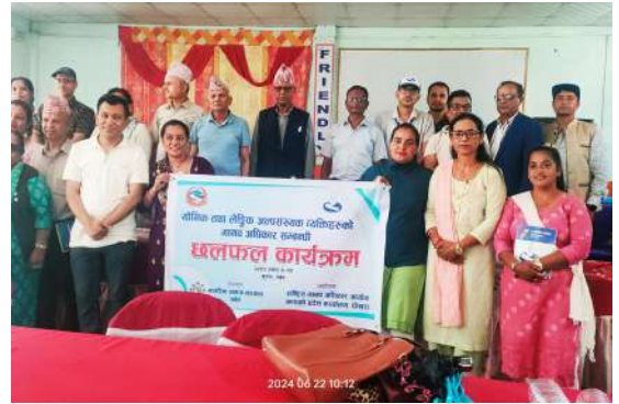
यौनिक तथा लैङ्गिक अल्पसंख्यक व्यक्तिहरूको मानव अधिकार सम्बन्धी छलफल कार्यक्रम पर्वत