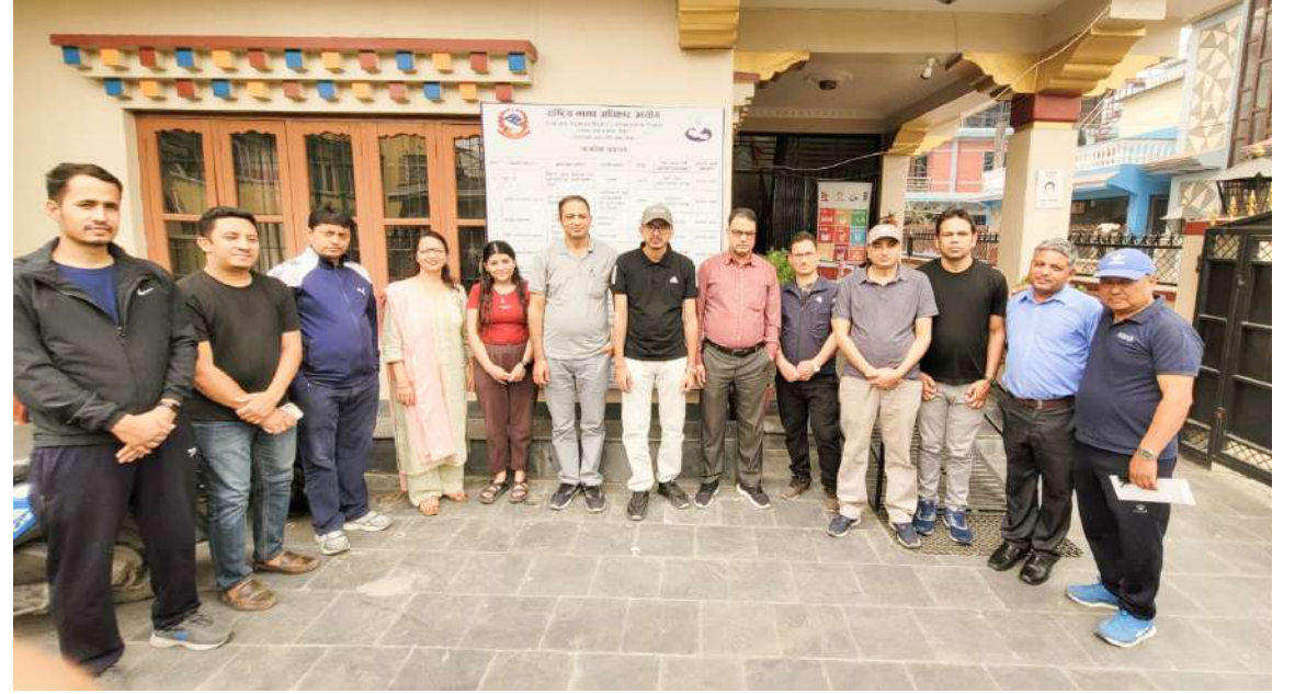
आयोगको केन्द्रिय कार्यालयद्वारा आयोजित उजुरी व्यवस्थापन तथा अभिलेखीकरण प्रणाली (CMRS) सम्बन्धी तालिममा सहभागिहरु