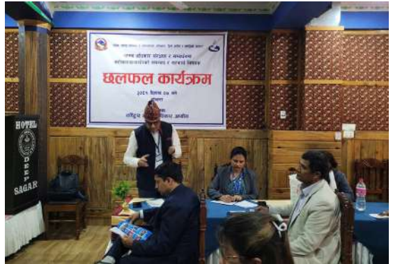
मानव अधिकार संरक्षण र संवर्धनमा सरोकारवालासँगको समन्वय र सहकार्य विषयक छलफल कार्यक्रम