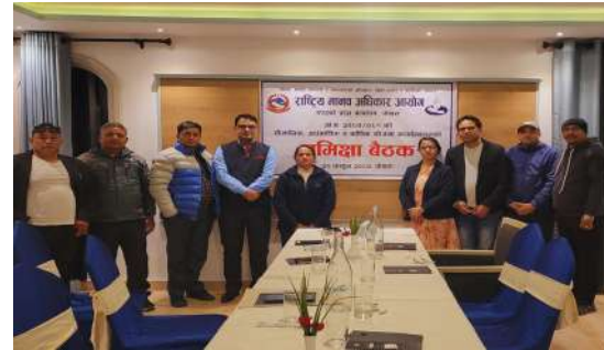
राष्ट्रिय मानव अधिकार आयोग गण्डकी प्रदेश कार्यालय, पोखराको चौमासिक अर्धवार्षिक र वार्षिक योजना कार्यान्वयनको समीक्षा बैठक, २०८० फागुन २१