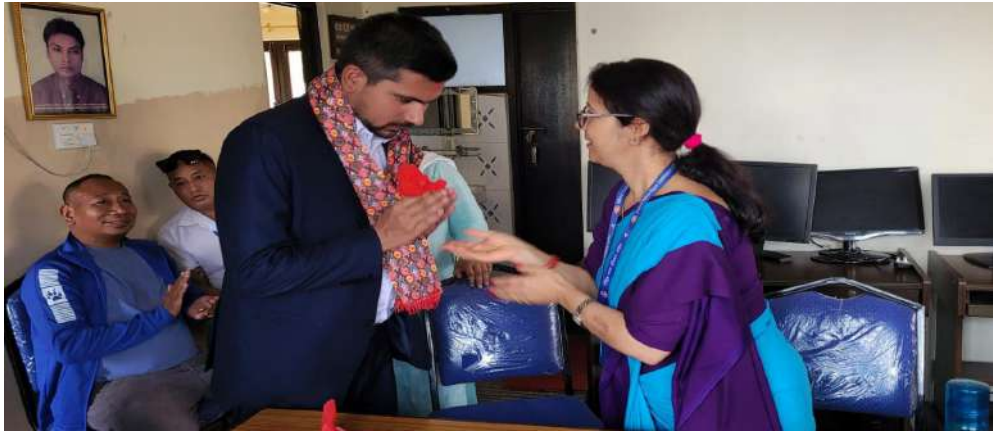
राष्ट्रीय मानव अधिकार आयोग, पोखरा कार्यालयमा नवनियुक्त कर्मचारीहरूको स्वागत कार्यक्रम