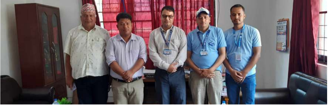
मानव अधिकार सम्बन्धी पाँचौँ राष्ट्रिय कार्ययोजना कार्यक्रमहरूको अवस्थाको अनुगमनको सिलसिलामा म्याग्दी जिल्ला समन्वय प्रमुख तथा समन्वय अधिकारीसँग छलफल