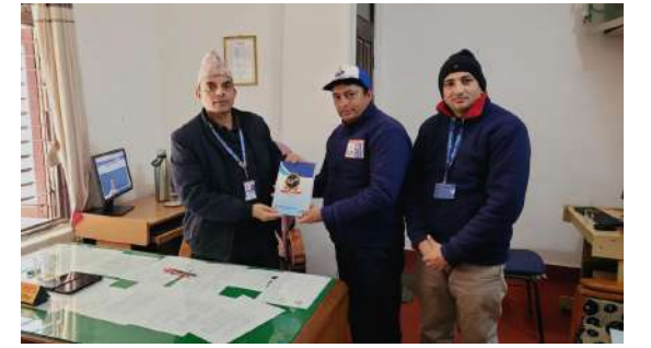
म्याग्दीमा मानव अधिकारको अवस्थाको बारेमा अनुगमनको क्रममा सहायक प्रमुख जिल्ला अधिकारीलाई आयोगको वार्षिक प्रतिवेदन हस्तान्तरण गर्दै आयोगको टोली