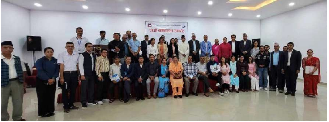
आयोगको २४औं वार्षिकउत्सव समारोहमा गण्डकी प्रदेशका माननीय मुख्यमन्त्री खगराज अधिकारी लगायत सहभागीहरू