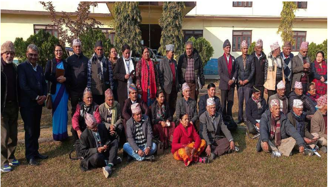
जेष्ठ नागरिकसँग बैठक - समन्वय कार्यक्रम