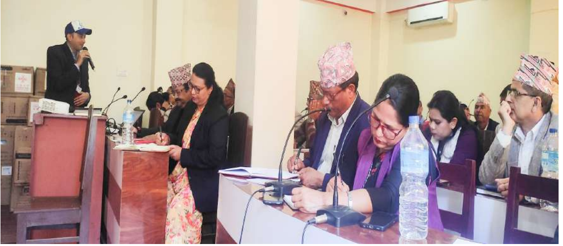
मानव अधिकार सम्बन्धी पाँचौँ राष्ट्रिय कार्ययोजना कार्यक्रमहरूको अवस्था विषयक अन्तरक्रिया कार्यक्रम, नवलपरासी (वर्दघाट सुस्ता पूर्व)