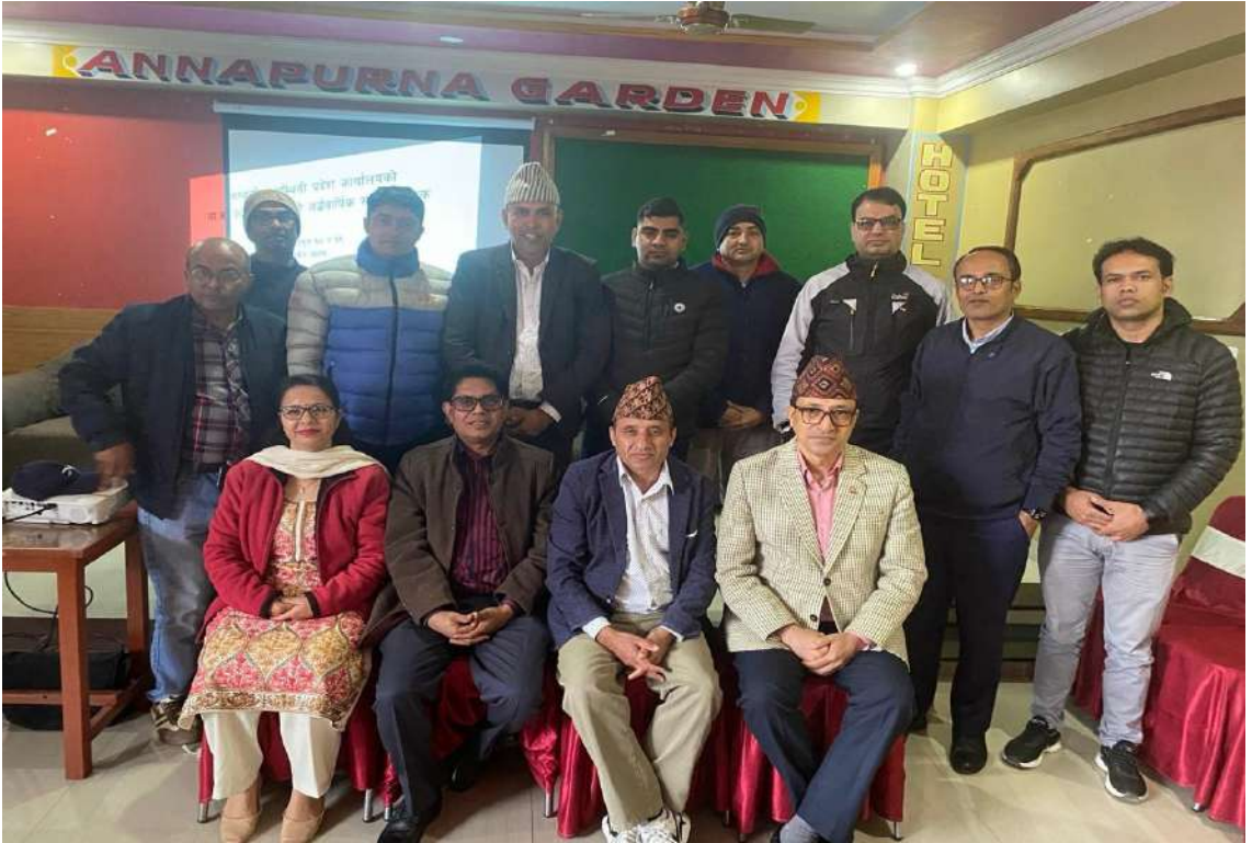
राष्ट्रिय मानव अधिकार आयोग गण्डकी प्रदेश, पोखरा कार्यालय र लुम्बिनी प्रदेश, बूटवल कार्यालयको संयुक्त अर्धवार्षिक समीक्षा कार्यक्रम, २०८० फागुन १८ र १९, पाल्पा